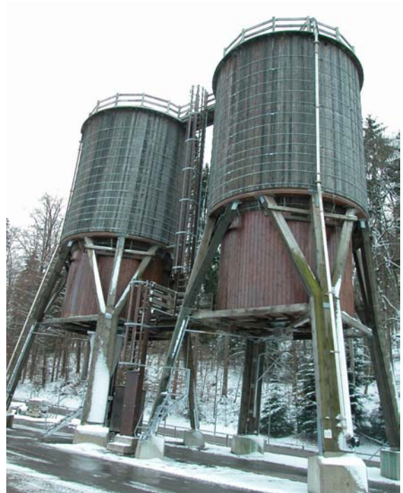
Salzsilo Anlage in Herisau (AR)

Je nach Anforderungen an die Anlage sind die folgenden Standardvarianten erhältlich: